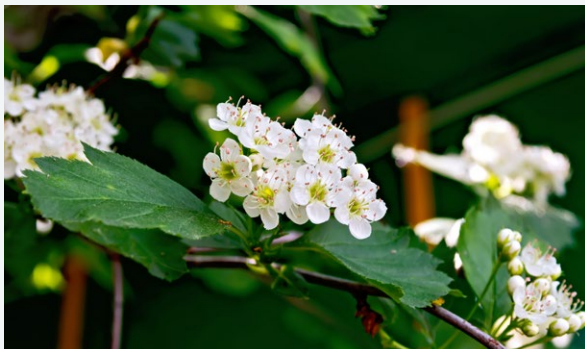
Weißdorn ( Crataegus )

Das homöopathische Arzneimittel Homviocorin enthält harmonisch aufeinander abgestimmte Wirkstoffe aus der Natur: Adonisröschen ( Adonis vernalis ), Maiglöckchen ( Convallaria majalis ), Weißdorn ( Crataegus ) und Meerzwiebel ( Urginea maritima ), die in unterschiedlicher Weise die Beschwerden bei leichten Formen von Herzschwäche erleichtern. Die Heilkraft dieser Heilpflanzen macht Homviocorin zu einem gut verträglichen homöopathischen Kombinationsarzneimittel. Wechsel- und Nebenwirkungen mit anderen Präparaten sind nicht bekannt.